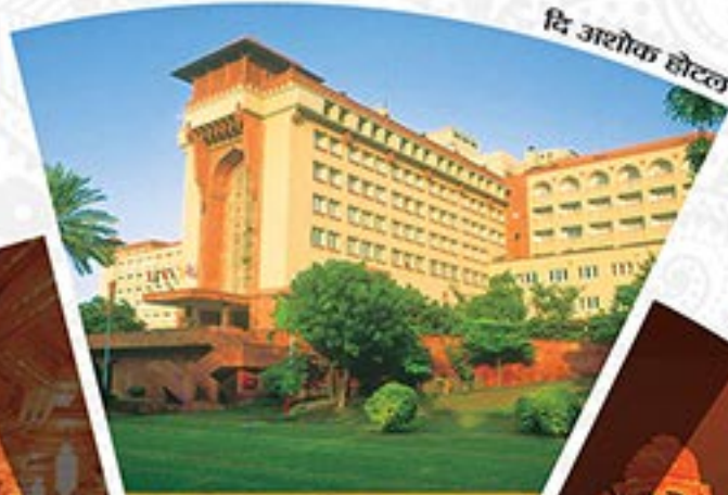
दि अशोक होटल