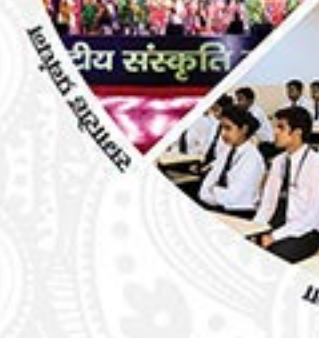
यात्रा व टुरिज्म

होटल व खानपान | कांफ्रेंस व सम्मेलन | शुल्क मुक्त खरीदारी एयर टिकटिंग | यात्रा व परिवहन | कार्गो हैंडलिंग आतिथ्य शिक्षा एवं प्रशिक्षण | समारोह प्रबंधन | प्रचार एवं परामर्श पर्यटन अवसंरचना परियोजनाएं | ध्वनि व प्रकाश प्रदर्शन | प्रिंट प्रोडक्शन