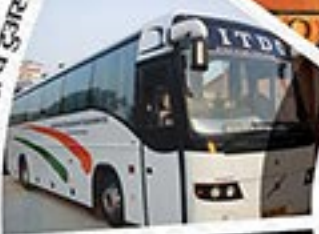
अशोक ट्रेवल्स व टुरिज्म

आपकी यात्रा, पर्यटन एवं आतिथ्य संबंधी सभी आवश्यकताओं के लिए एक स्थान पर समस्त समाधान